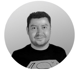
Oscar Céspedes Diseño gráfico